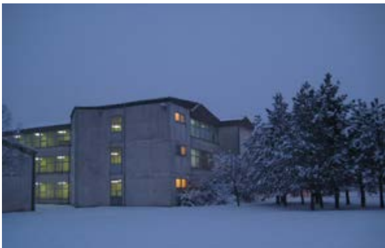
Osnovno sikipe ano Nikšićo